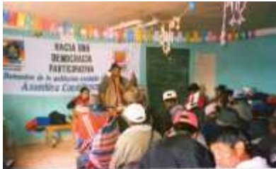
Taller en la comunidad de Caracollo. Los investigadores realizaron 28 talleres.

Para qué repetirlo, la Asamblea Constituyente es la oportunidad de participar en la construcción de país diferente y de una Carta Magna que refleje verdaderamente la voluntad de todos. Desde la investigación, un equipo de profesionales de Oruro hizo un aporte a esta construcción, recogiendo las demandas y propuestas de sectores de la sociedad históricamente excluidos, con el propósito de enriquecer el debate regional y nacional.