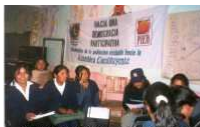
Los jóvenes también participaron de la consulta en el departamento de Oruro.

En cuanto a los órganos del Estado, hay una percepción de que existe crisis del sistema político boliviano y los cuestionamientos a la administración de justicia –en muchos casos, parcializada a favor de los poderosos– ha dado lugar al planteamiento de propuestas orientadas a la reconfiguración de los principales órganos de poder del Estado. De manera amplia, todos los sectores consultados apuntaron a la reducción de las dos cámaras del Congreso a una sola, así como a la disminución del número de parlamentarios. El 71 por ciento de la población encuestada sugirió un Congreso unicameral y sólo el 29 por ciento que se mantenga en dos cámaras. Y a la pregunta ¿cuántos parlamentarios debería tener el Congreso Nacional?, el 91 por ciento respondió que menos, siempre bajo el criterio de ahorro de presupuesto a la nación.